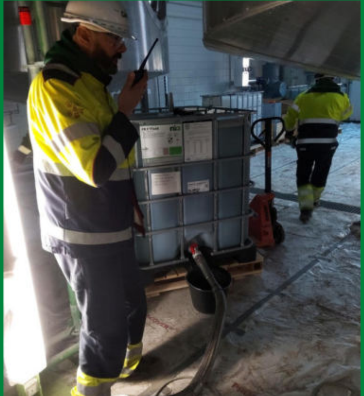
Een IBC FR3 olie wordt ingetrokken voor de commissioning van de ontgassers